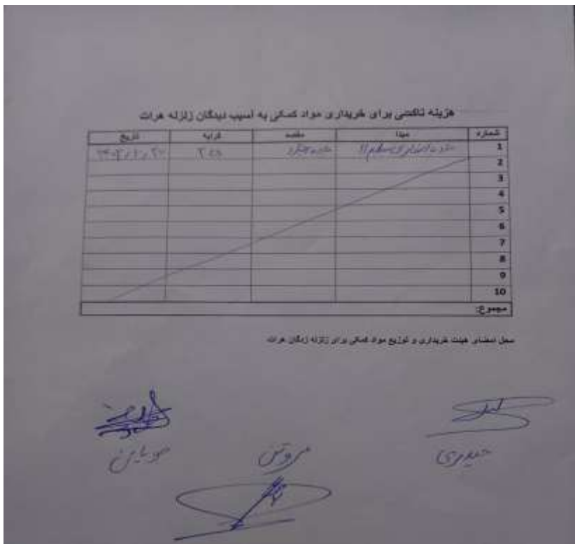
فاکتور هزینه تاکسی برای خریداری مواد