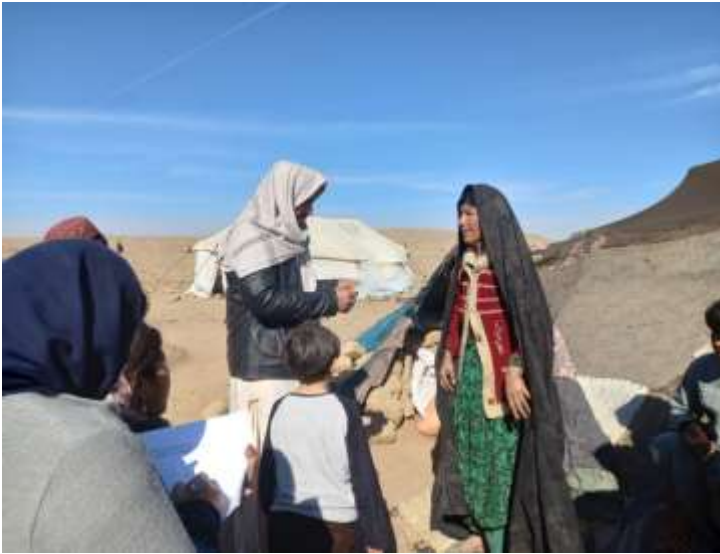
ثبت اسامی خانواده‌ها