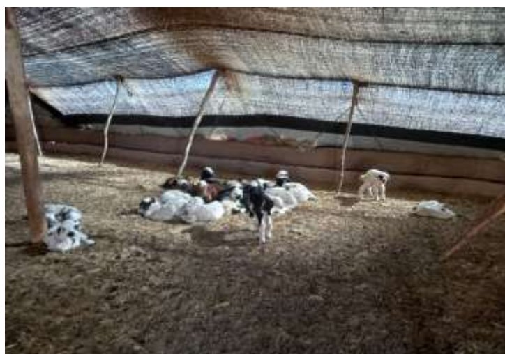
در این منطقه دامداری اصلی‌ترین راه امرار معاش ساکنین است و مکان نگهداری مویشی به خاطر زلزله کاملاً از بین رفته و مردم با استفاده از چادر این سر پناه‌ها را برای حیوانات ساخته‌اند.