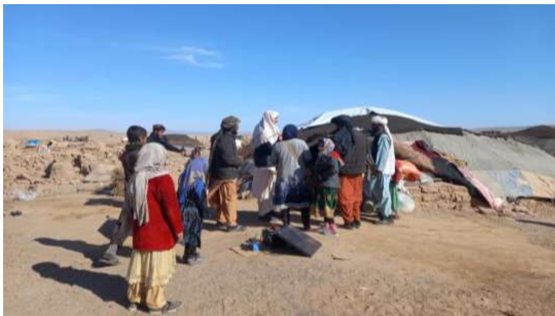
یکی از اعضای تیم در حال صحبت با خانوادهها. به آن سولر کوچک دقت کنید. مردم دسترسی به برق ندارند و با این امکانات کم، ممکن است تنها بتوانند چراغی در شب روشن کنند.

عکس‌هایی از جریان روز توزیع در قریه چاه آزادی: