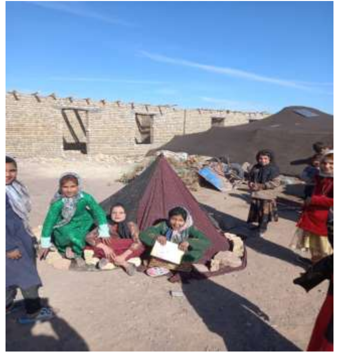
شاید این خیمه کوچک محلی برای بازی کودکان باشد. چهره‌ها خود سخن می‌گویند.