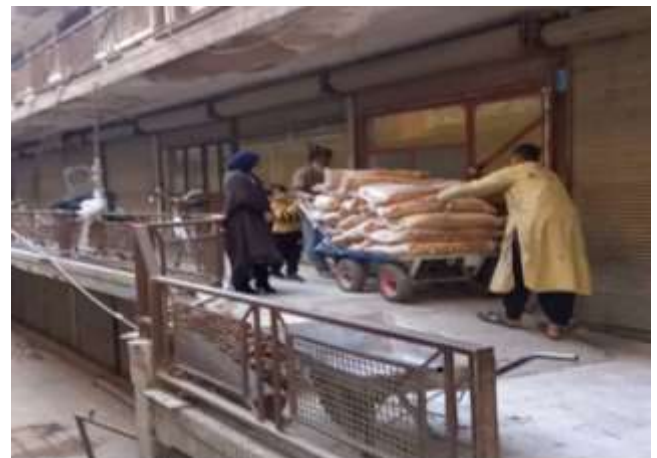
انتقال برنج‌های خریداری شده