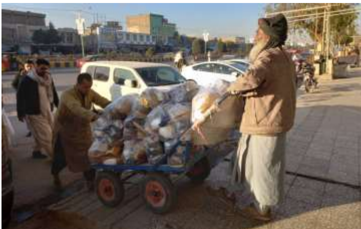
انتقال مواد خریداری شده به موتر (ماشین)