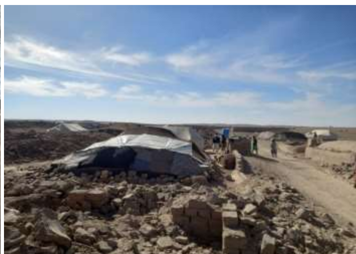
منطقه چاه آزادی، محله هلال زائی‌ها