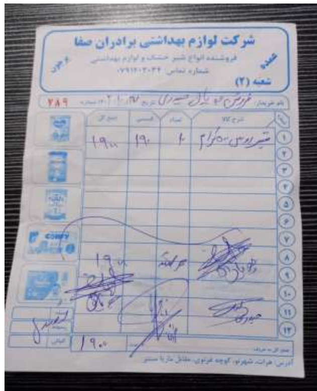
فاکتور خرید شو شو خشک (۱۰ عدد)