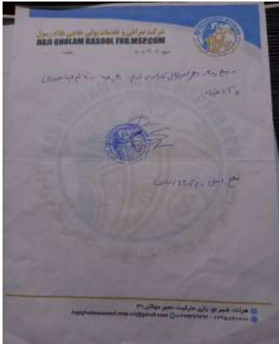
فاکتور مبلغ 200 دالر که توسط صرافی حاجی غلام رسول به دست خانم لینا حیدری رسیده است.