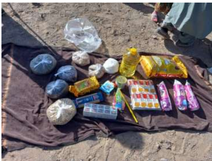
مواد داخل هر بسته