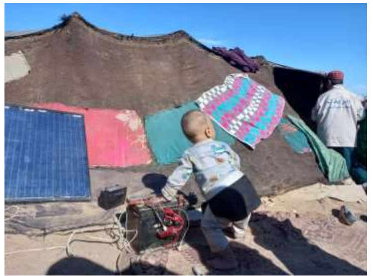
چادرهایی که اکنون خانه مردم شده است. کودکان در این میان بیش از همه در معرض بیماری و سرما قرار دارند.